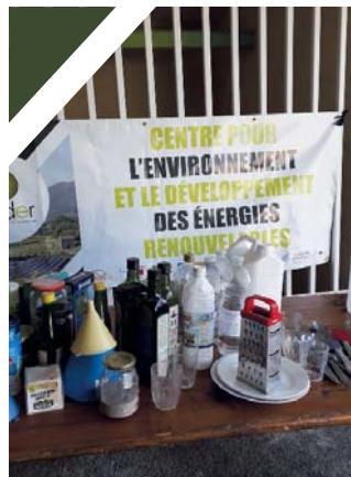
Perrine DYON / CEDER